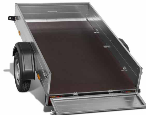
SARIS King XL 75 Mit Plane und Spriegel

* Aktionsbedingungen unter www.saris.net